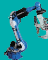
②中・大型機種プラン