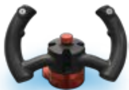
▲ハンドガイド装置